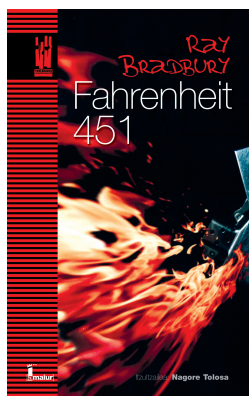
Fahrenheit 451 Ray Bradbury