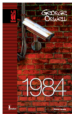
1984 George Orwell